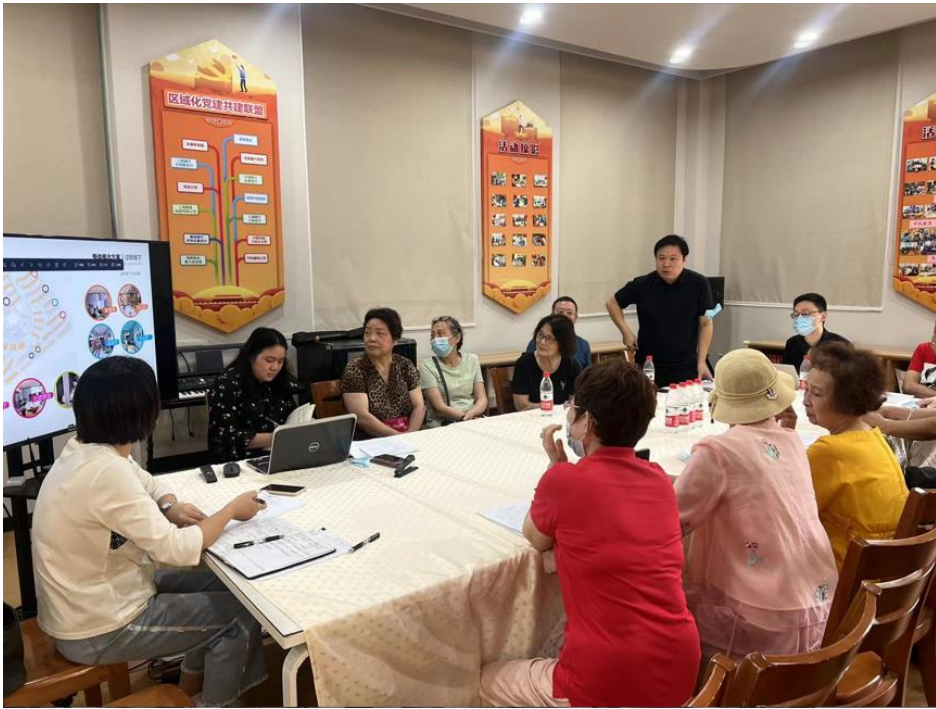
赋能团队参加三林苑社区议事会