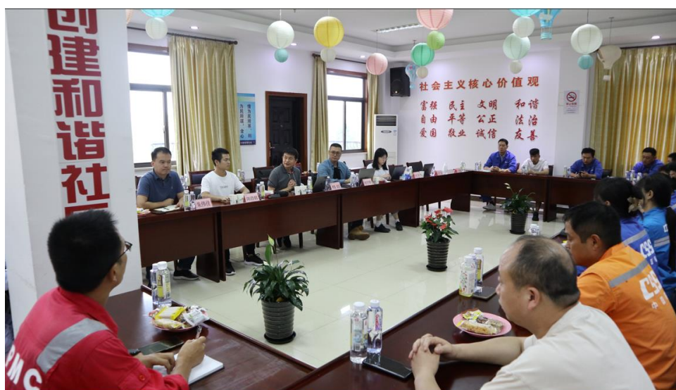
赋能团队在崇明长兴家园调研