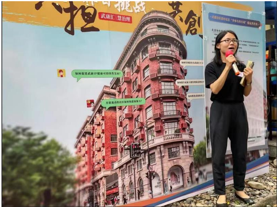
赋能专家在武康路社区宣讲