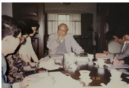
跟随费孝通在浦东调研

6 月 24 日，上观新闻在公众号发布了对李友梅教授的专访，介绍李老师从南开大学社会学专业班起步，到跟随费孝通先生调研江村，再赴法国巴黎学习借鉴西方先进研究方法，循着前辈学者开辟的“从实求知”路径，保持着定力，提升着能力，不遗余力推动中国社会学发展创新。