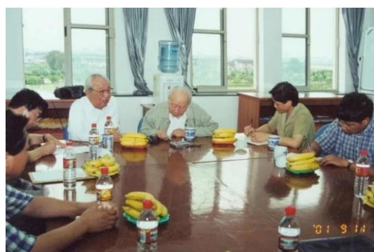
与费孝通、钱伟长讨论学科建设

6 月 21 日（周二），社会学院 2022 年度公共性论坛第一期开讲。公共性论坛是院内老师和同学交流最新研究成果的学术平台，本年度由肖瑛教授开讲，主题为“迷失与重建：论‘家’在福柯的治理术论述中的性质及变迁”。黄晓春教授主持，杨镭教授、李荣山副教授为评议人，学院师生 200 多人参加。